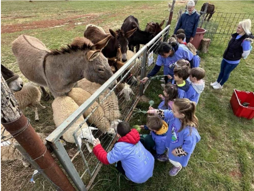
Skupina Zvezdice u posetu magarečoj farmi u Kaštelu