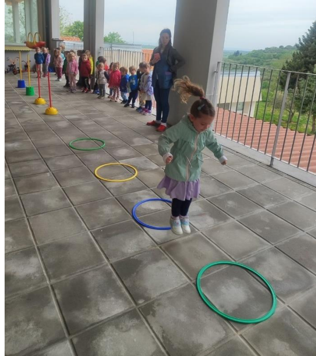
skupina Balončići, poligon na terasi vrtića